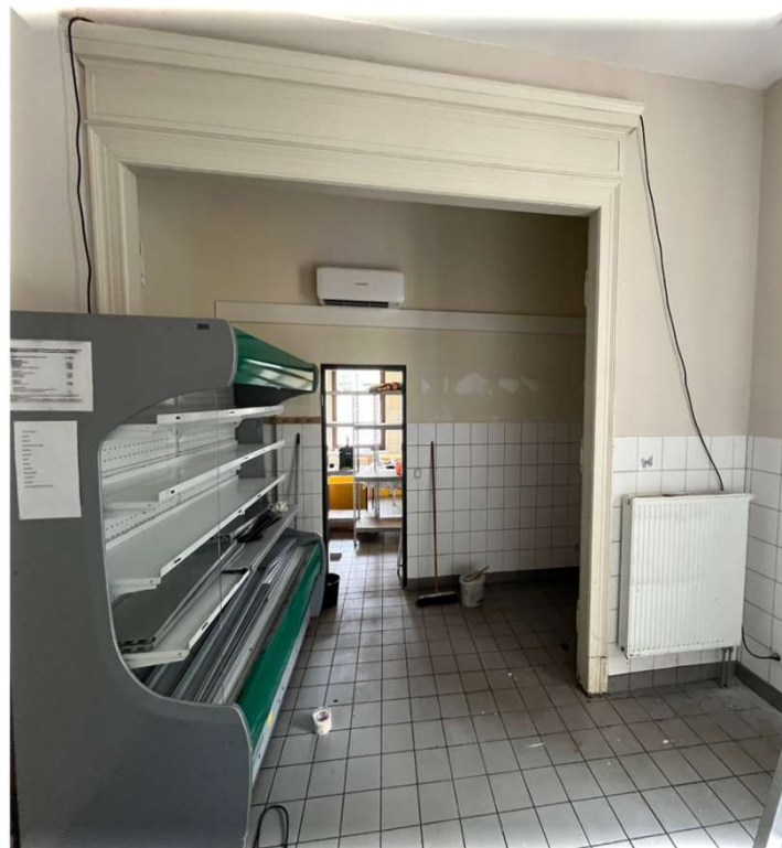
Renovierung Tafelräume nach Wasserschaden