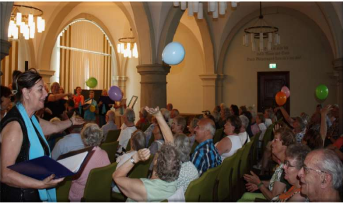
Tag der Senioren