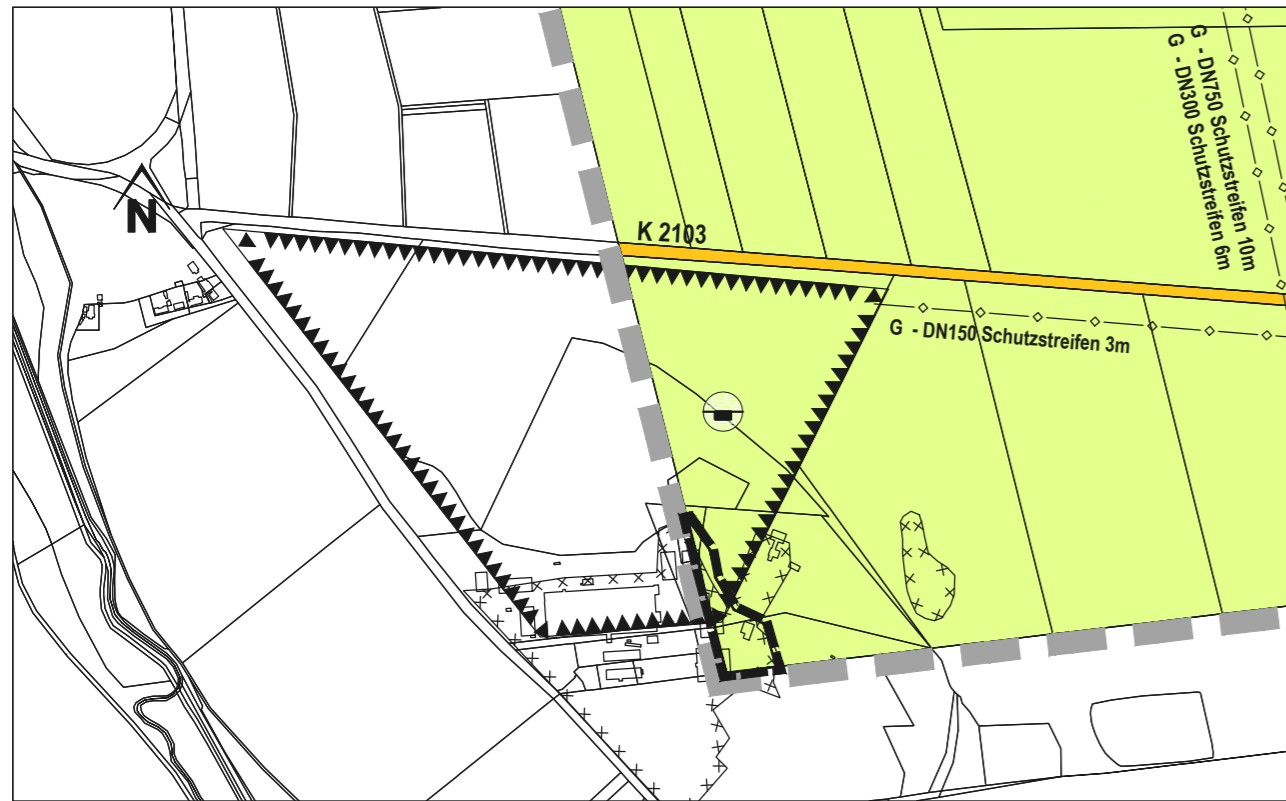
Ausschnitt aus dem wirksamen FNP

Bernburg (Saale), ..... Oberbürgermeister