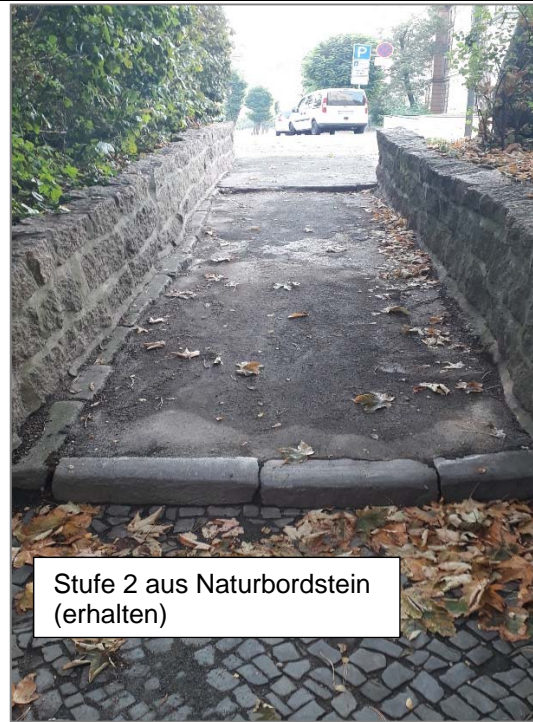
Stufe 2 aus Naturbordstein (erhalten)