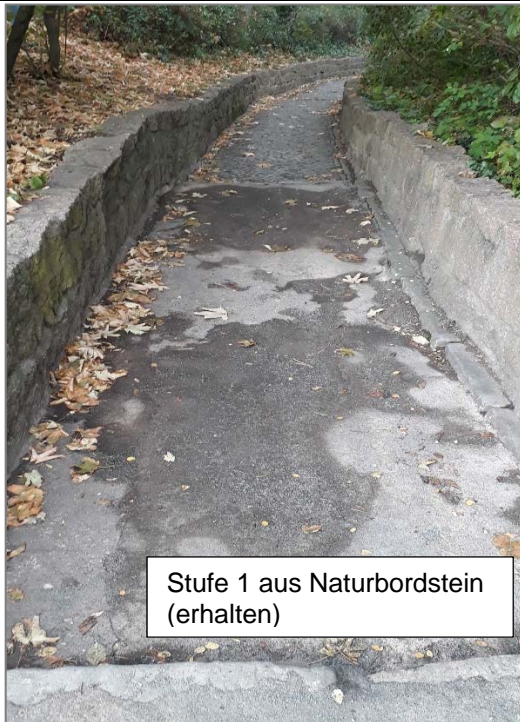
Stufe 1 aus Naturbordstein (erhalten)